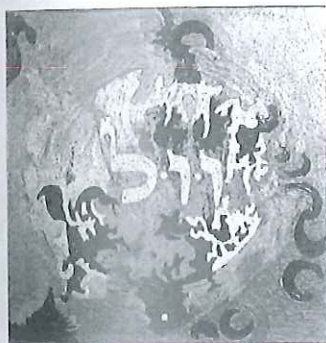
Carabba, Camed Waw Camed , 2011, acrilico, foglia oro, filo e fosforo su tavola 25 x 25 cm, € 1.500/A

Formazione: durante gli studi al Liceo Internazionale comincia a interessarsi di poesia e di pittura. Si forma artisticamente nella Milano degli anni Cinquanta e Sessanta, avvantaggiandosi del supporto e dell'influenza formativa di artisti come H. Chin, E. Baj, R. Crippa, E. Castellani e altri protagonisti dell'arte del momento. Periodi: nella seconda metà degli anni Sessanta lavora sulla rifrazione della luce, ottenendo una superficie di intensità luminosa variabile; negli anni Settanta i quadri diventano componibili, per aumentare le possibilità di interazione dell'osservatore e superare la visione statica e passiva. Nel decennio successivo è in California e opera sui simboli delle sue radici. Dal 1988 ha ripreso il lavoro sulla luce dei primi anni, inserendo colori fluorescenti e fosforescenti, ottenendo per l'opera visioni multiple. Soggetti: cieli, comete e vibrazioni connessi con ricerche sugli angeli delle Sefiroth della Kabbalah. Tecniche: miste su tela, carta e plastica; installazioni.