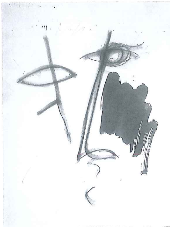
Caraccio, Incontro , 2001, gouache su carta 46 x 68 cm, € 7.000

dove prosegue la già notevole attività espositiva. Periodi: negli anni Settanta si dedica prevalentemente alla scultura, non tralasciando la pittura: in entrambi gli ambiti consegue diversi premi e riconoscimenti. «(...) è indubbiamente un artista che ha percorso una strada propria, autonoma rispetto a tutti i diktat delle aspettative culturali e visive dell'ultimo momento, indipendente dalle mode dell'ultima ora e dai condizionamenti mediatici» (M. Coronati). Considerato dalla critica internazionale uno dei maggiori esponenti italiani dell'Espressionismo Moderno, parallelamente ai numerosi eventi espositivi che lo vedono protagonista in Italia, a partire dal 2008 è invitato da galleristi e istituzioni cinesi a presentare la sua opera in diversi